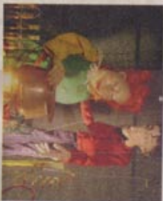
Compagnia Autanzen- tibus. A destra dall'alto: El Chocoban e Teatro Golodnikov. Sotto: le marionette di Cernovisti in al mestieri di Londra.

La manifestazione, che tornerà con la quindicesima edizione per una settimana a partire da sabato 20 giu- gno in giro per la città, si snoderà per l'inaugurazione per tra i Giardini della Sta- zione, piazza San Donato e il Teatro del Lavoro fino dal- le 16. Si spazzerà come al so- lito tra il cartellone portan- te, con compagnie da ogni parte del mondo, come La Piccola Locucola dalla Spa- gna che inaugurerà i festini musicali della tradizione ca- stigliana sulla ricerca della originale dei burattini e sulla loro velleità attuale, o come il «Noi e il teatro» di Pinerolo a Due Puntici e le sue pa- rattelle. In scena ci sarà lo storico personaggio del- l'Emilia Romagna, Pagnò- na, con il Teatro alla Panta- na anche i sarati di Marco Reddes. Dal Sudafrica la