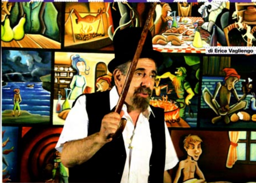
di Erica Vagliengo