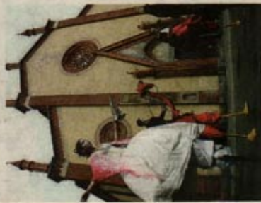
Il teatro di figura